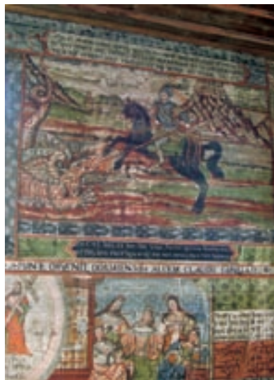
Hervartov, Kostol sv. Františka Asisského

K pamiatkovým hodnotám patrí nielen bezprostredné historické prostredie pamiatok. Súčasťou pamiatkového fondu sú aj pamiatkové územia. Ich základným znakom je zachovanosť priestorového a pôdorysného usporiadania t. j. ich urbanisticko-architektonická štruktúra . Ochrana územia s uceleným historickým sídelným usporiadaním a s veľkou