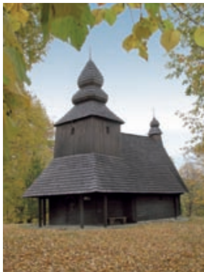
Ruská Bystrá, Kostol sv. Mikuláša

Informácie o tom, či je objekt evidovaný ako národná kultúrna pamiatka, možno získať na webovej stránke PÚ SR www.pamiatky.sk alebo e-mailom na adrese: uzkp@pamiatky.gov.sk .