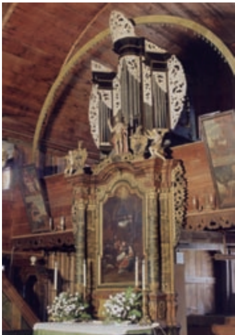
Interiér artikulórného kostola v Hronseku

Možný je iba jej dočasný vývoz na základe povolenia Ministerstva kultúry SR po predchádzajúcom vyjadrení pamiatkového úradu, najdlhšie na tri roky (najčastejšie ide o dôvod reštaurovania alebo vystavovania). Ministerstvo môže vydanie povolenie viazať na určité podmienky (napr. poisťná zmluva).