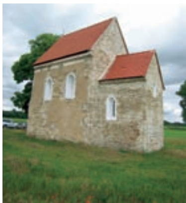
Kopčany, Kostol sv. Margity Antiochijskej

a o jeho činnosti od najstarších dôb, spravidla sa našla alebo sa nachádza v zemi, na jej povrchu alebo pod vodou. Archeologický nález je vlastníctvom Slovenskej republiky. Správcom archeologického nálezu je Pamiatkový úrad SR. Správcom archeologického nálezu môže byť tiež Archeologický ústav SAV alebo múzeum zriadené ústredným orgánom štátnej správy v prípade, ak ide o nález nájdený počas nimi vykonávaného archeologického výskumu. Archeologický výskum môže vykonať len oprávnená osoba na základe oprávnenia vydaného Ministerstvom kultúry SR. Pokiaľ sa archeologický nález nájde mimo výskum a nálezca ho najneskôr do dvoch pracovných dní ohlási príslušnému krajskému pamiatkovému úradu, má nálezca nárok na vyplatenie nálezného až do výšky 100 % hodnoty archeologického nálezu, ktorého hodnotu určuje znalecký posudok. Je však zakázané používať detekčné zariadenia ako aj vyzdvíhovať archeologické nálezy zistené pomocou detektorov kovov, takéto konanie môže byť posudzované ako trestný čin.