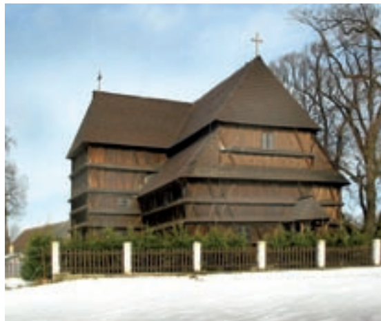
Hronek, evanjelický artikulárny kostol

Pri orientácii, ktoré predmety patria do tejto skupiny, je najlepšou pomôckou materiál, ktorý bol odovzdaný v rokoch 1993 až 1995 proti podpisu každému správcovi sakrálného objektu vtedajším Pamiatkovým ústavom (tzv. Celoplošná fotodokumentácia, realizovaná pamiatkarmi v spolupráci s policajným zborom). Ďalší exemplár tohto materiálu sa nachádza v príslušnom KPÚ. Materiál obsahuje identifikačné listy nielen všetkých hnutelných kultúrnych pamiatok